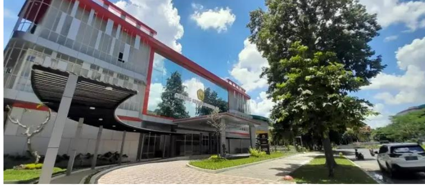
Gambar 3. Gedung Kewirausahaan Universitas Jember