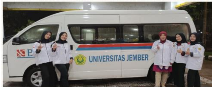
Gambar 13. Mobil Haice Universitas Jember

Mobil Haice Universitas Jember UNEJ memiliki 4 mobil Haice yang masing-masing berkapasitas 16 orang.