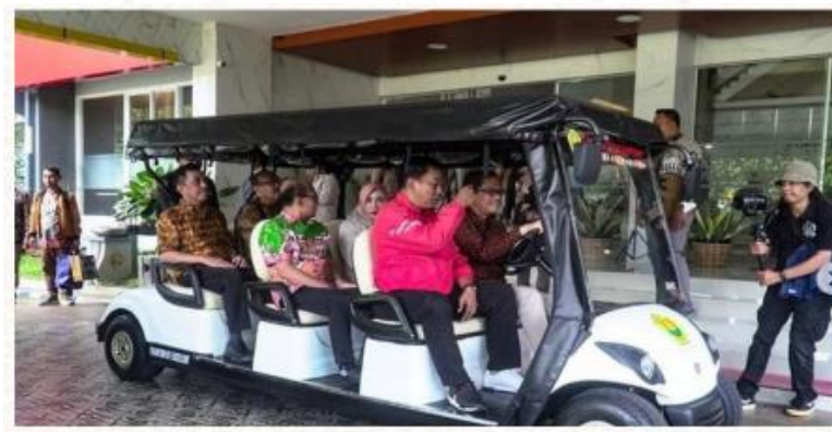
Gambar 1412. Mobil Golf Universitas Jember

Mobil Golf Universitas Jember Untuk memfasilitasi mobilitas juri, UNEJ menyediakan mobil golf sebanyak 2 unit.