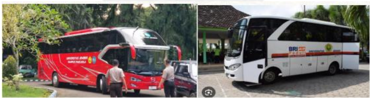
Gambar 11. Bis Kapasitas 55 Orang dan Bis Kapasitas 20 Orang

UNEJ memiliki fasilitas transportasi untuk memperlancar kegiatan ABDIDAYA ORMAWA 2023. Ada 2 tipe bis UNEJ, yaitu kapasitas 55 orang sebanyak 1 bis dan kapasitas 20 orang sebanyak 2 bis.