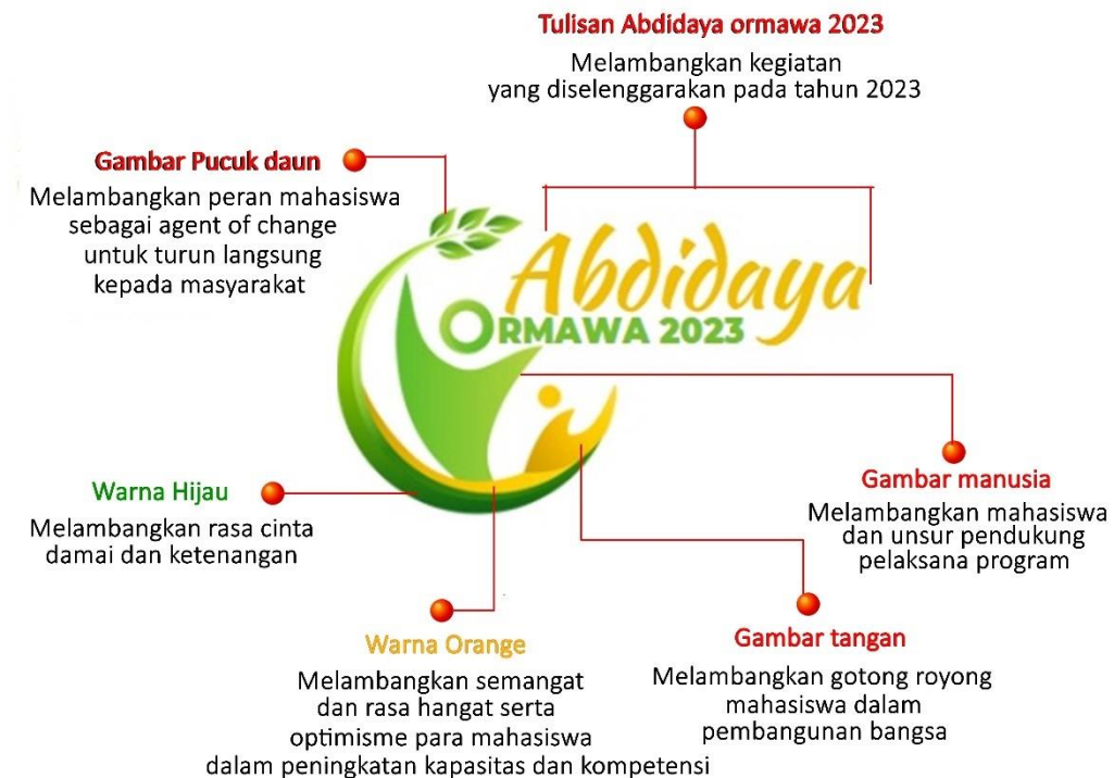
Gambar 1. Logo Abdidaya Ormawa 2023

Logo kegiatan Abdidaya Ormawa Tahun 2023 menjadi ikon utama Abdidaya Ormawa yang bersifat tetap dan menjadi acuan pada kegiatan Abdidaya Ormawa selanjutnya, sedangkan penulisan kata Abdidaya Ormawa dan tahun penyelenggaraan dapat dikreasikan sesuai dengan penyelenggara pada tahun tersebut. Berikut logo Abdidaya Ormawa tahun 2023 beserta filosofinya: