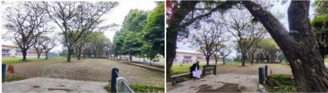
Gambar 6. Halaman Depan Gedung Auditorium Universitas Jember

Bazar UMKM Unggulan Kabupaten Jember merupakan kegiatan penunjang, yang di laksanakan pada tanggal 8 Desember 2023, pukul 10.00 - 17.00 WIB di halaman samping Gedung Soetardjo UNEJ. Bazar akan menghadirkan pelaku UMKM kabupaten Jember. Disamping kegiatan pameran UMKM, panitia juga menyediakan stand makanan dan minuman yang bisa dibeli oleh peserta abdidaya Ormawa 2023.