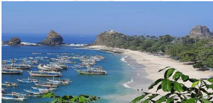
Gambar 148. Pantai Papuma

Pantai Papuma merupakan singkatan dari Pantai Putih Malikan, dan memiliki nama lain, yaitu Tanjung Papuma. Pantai Papuma berada di Desa Lojejer, Kecamatan Wuluhan, Kabupaten Jember, Provinsi Jawa Timur.