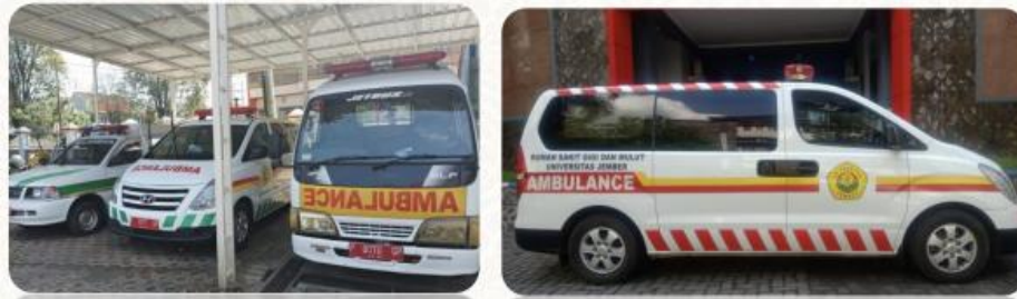
Gambar 136. Mobil Ambulance

medis darurat dan transportasi yang aman bagi peserta yang membutuhkannya. Fasilitas ambulance yang disediakan UNEJ dilengkapi dengan peralatan medis dan tenaga medis yang terlatih untuk merespons dan menangani situasi kesehatan darurat.