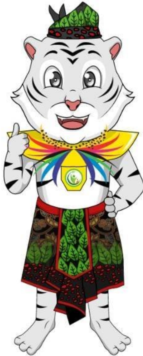
Gambar 2. Maskot Abdidaya Ormawa 2023