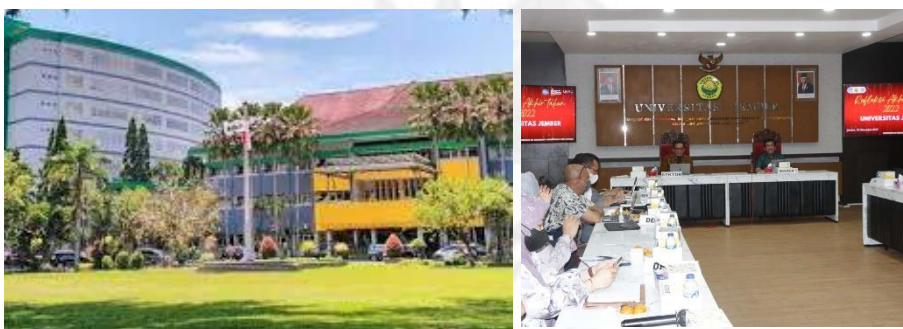
Gambar 10. Gedung rektorat Universitas Jember lantai 2