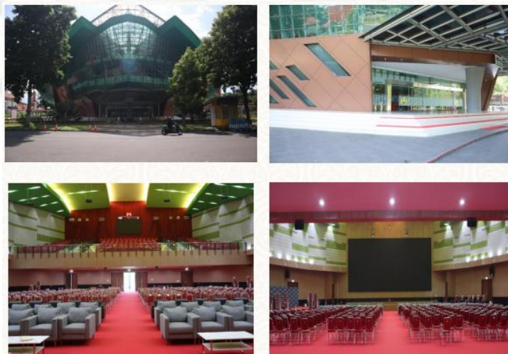
Gambar 4. Gedung Auditorium Universitas Jember