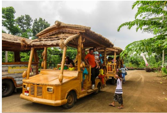
Gambar 17. Fasilitas Mobil di Kebun Renteng, Pusat Penelitian Kopi dan Kakao