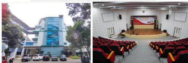
Gambar 8. Gedung Soejarwo Universitas Jember

Hasil diskusi terkait 3 hal diatas akan disusun dalam bentuk policy brief (yang akan disepakati dalam rapat Pleno) yang dapat digunakan sebagai referensi oleh Kemdikbudristek, khususnya Direktorat Pembelajaran dan Kemahasiswaan dalam merumuskan kegiatan PPK Ormawa dan pengabdian mahasiswa di tahun mendatang. Selain itu dalam sarasehan Ormawa ini dibahas dan dihasilkan kesepakatan yang dituangkan dalam pakta integritas dan ditandatangani oleh seluruh perwakilan ormawa peserta ABDIDAYA ORMAWA 2023.