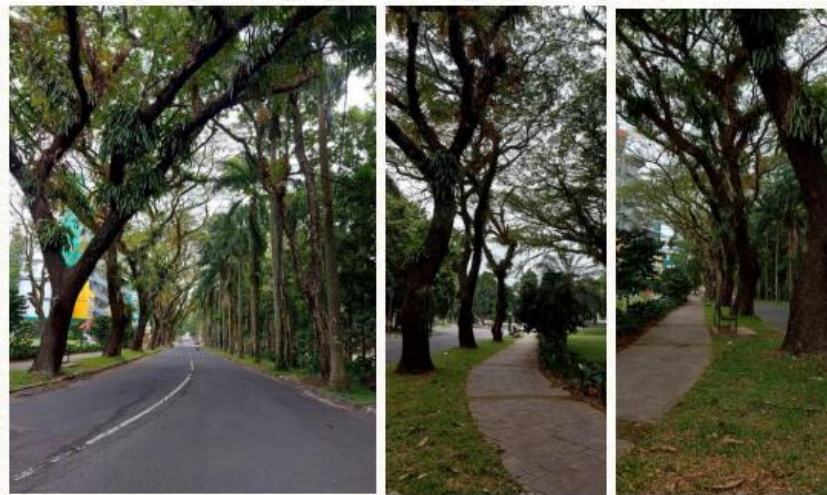
Gambar 10. Lingkungan Universitas Jember

UNEJ mengusung konsep Green Campus sehingga pohon rindang terdapat pada semua jalan di dalam kampus UNEJ disertai dengan pedestrian yang nyaman untuk pejalan kaki.