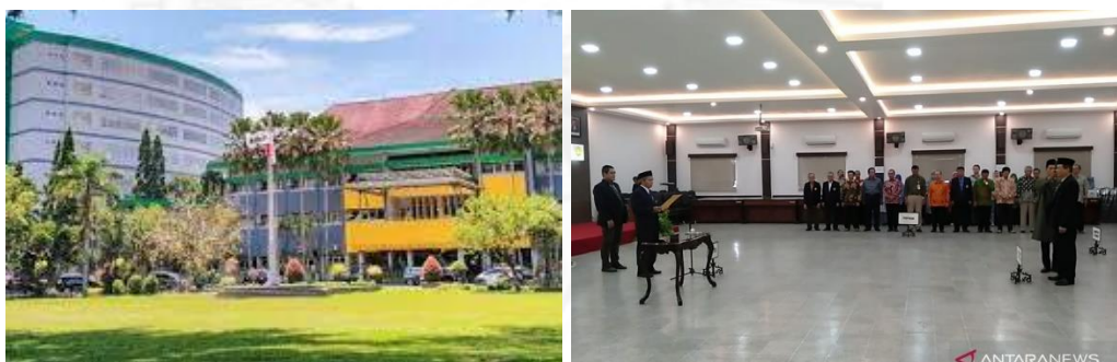
Gambar 9. Gedung rektorat Universitas Jember lantai 3

Hasil diskusi terkait 4 hal diatas akan disusun dalam bentuk rekomendasi teknis yang akan disampaikan pada rapat Pleno sarasehan