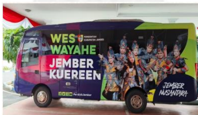
Gambar 15. Bis Pemerintahan Daerah Jember

Selain alat transportasi milik UNEJ, kegiatan ABDIDAYA 2023 didukung alat transportasi milik Pemda Jember berupa bis kapasitas 20 orang sebanyak 5 unit.